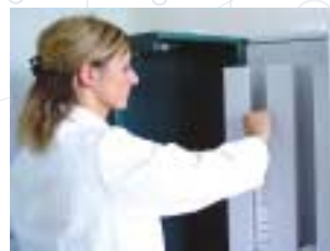
Industrielle Herstellung der Lava Gerüste